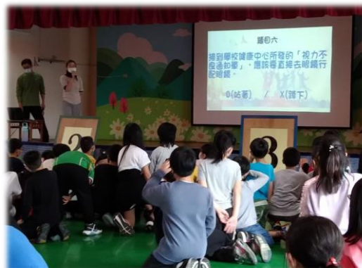
兒童節活動-知識擂台賽