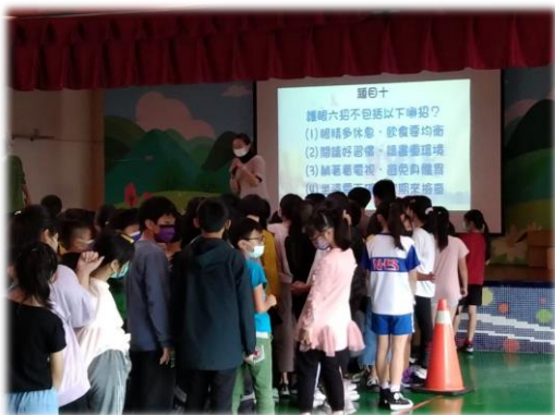
兒童節活動-知識擂台賽