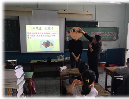
視力保健融入課程